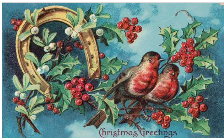
Vistga e fegliaspina – simbols tradizionalis dal temp da Nadal e Bumaun en il territori anglosaxon.